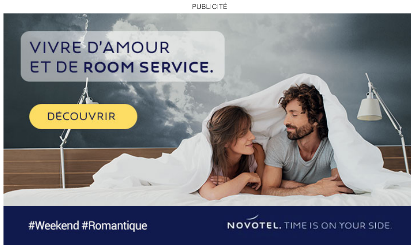
inRead invented by Teads